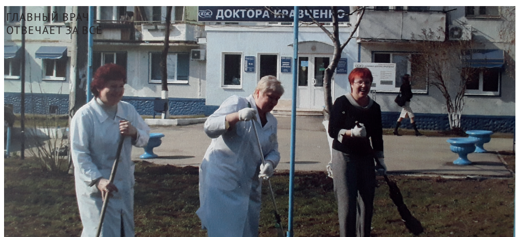
ГЛАВНЫЙ ВРАЧ ОТВЕЧАЕТ ЗА ВСЕ