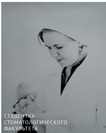
СТУДЕНТКА СТОМАТОЛОГИЧЕСКОГО ФАКУЛЬТЕТА