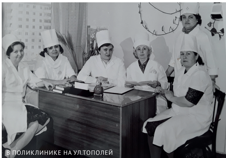
В ПОЛИКЛИНИКЕ НА УЛ.ТОПОЛЕЙ

чила игрушкам зубы. Так что все же выбор профессии был не случаен.