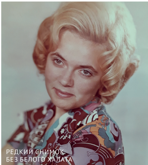
РЕДКИЙ СНИМОК БЕЗ БЕЛОГО ХАЛАТА

- Так получилось. Никогда в жизни я не стремилась занять руководящую должность. Я вообще не публичная. Даже в отпуске я не люблю фотографироваться. Но вот так