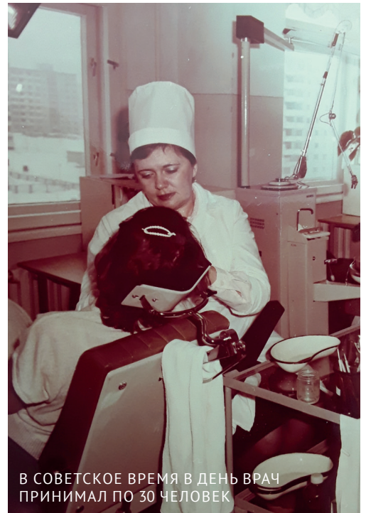
В СОВЕТСКОЕ ВРЕМЯ В ДЕНЬ ВРАЧ ПРИНИМАЛ ПО 30 ЧЕЛОВЕК

- Врач отвечает за пациентов. А главный врач отвечает за все, что происходит в клинике: начиная от того, как пострижена трава газона у входа, заканчивая нюансами лечения каждого отдельно взятого человека. Даже если я не консультирую пациента