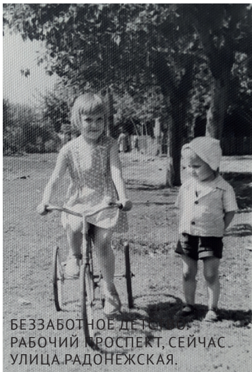
БЕЗЗАБОТНОЕ ДЕТСТВО. РАБОЧИЙ ПРОСПЕКТ, СЕЙЧАС УЛИЦА РАДОНЕЖСКАЯ.

красным дипломом, я могла сразу же поступать в институт, мне не надо было отработать несколько лет. Я выбрала стоматологию, можно сказать, случайно. Почему-то мне показалось, что могу не пройти на гинекологию, куда сняла хотела идти. Хотя на самом деле вступительный балл на стоматологическом факультете был выше. Вот так все и сложилось. После окончания института по распределению я попала в Казахстан. 1,5 года я проработала в прекрасном месте – порт Шевченко. Уехав оттуда, я несколько раз приезжала в гости к удивительным людям, с которыми там познакомилась. Можно было бы там остаться, но я очень