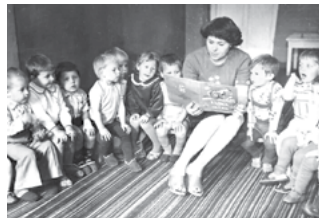
Чтение в детском саду