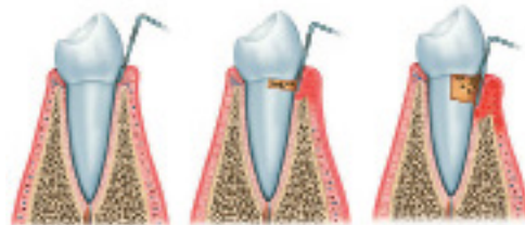
здоровый зуб гингивит пародонтит

Обычно пародонтиту предшествует ГИНГИВИТ . Это одно из самых общеизвестных заболеваний пародонта. Оно встречается и у взрослых, и у детей. В той или иной степени им страдает практически 90% населения нашей планеты.