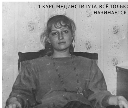
1 КУРС МЕДИНИТУТА. ВСЁ ТОЛЬКО НАЧИНАЕТСЯ...

Мне всегда хотелось получать от жизни максимум впечатлений, именно поэтому в 15 лет я начала заниматься парашютным спортом. В моей копилке: 10 прыжков с парашютом и третий разряд по парашютному спорту. И кстати, моему примеру последовали некоторые одноклассники.