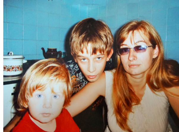
С ЛЮБИМЫМИ ДЕТЬМИ