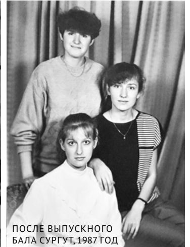
ПОСЛЕ ВЫПУСКНОГО БАЛА СУРГУТ, 1987 ГОД